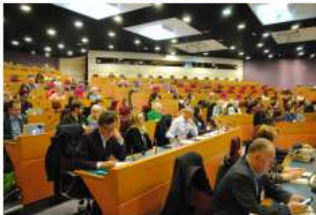
Le 1er Colloque sur les Salariés Aidants, regroupant 240 participants, s'est tenu le 17 mai dans l'hémicycle de la Région Île-de-France.

De nombreux besoins ont pu également être remontés permettant de mieux orienter nos actions sur cette thématique en 2020.